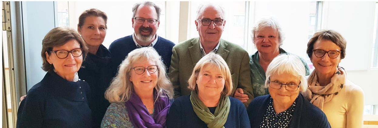
Sykehusets Brukerutvalg 2023.

Målet med Brukerutvalget er å styrke pasienters og pårørendes stilling og innflytelse ved å skape gjensidig tillit og forståelse gjennom dialog og brukermedvirkning.